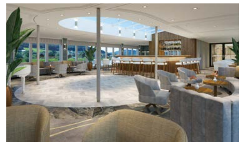
Lounge – LADY DILETTA