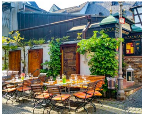
Impressionen in Rüdesheim

sich ein buchbarer Ausflug mit dem „Winzerexpress“: Sie fahren durch das kleine Städtchen hinauf in die Weinberge zum Niederwalddenkmal. Von hier aus genießen Sie einen fantastischen Blick über das gesamte Rheintal. Mit dem Bähnchen geht es anschließend weiter zu „Siegfrieds Musikkabinett“, wo rund 350 selbstspielende Musikinstrumente aus drei Jahrhunderten ausgestellt sind. Sie erfahren alles über Orchester, Spielorgeln und die Kunst, Musik mechanisch-physikalisch aufzuzeichnen und wiederzugeben. Im Anschluss haben Sie noch genügend Zeit den Ort in eigener Regie zu erkunden. Unverzichtbar ist ein Besuch der Drosselgasse.