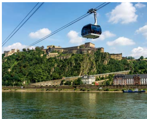
Blick auf die Burg Ehrenbreitstein mit der Seilbahn

Am Deutschen Eck, wo die Mosel in den Rhein fließt, liegt Koblenz, eine der ältesten Städte Deutschlands. Lernen Sie die Zeugnisse der über 2000-jährigen Geschichte der Stadt kennen. Entdecken Sie Schlösser, ehemalige Adelshöfe und herrschaftliche Bürgerhäuser, enge Gassen und romantische Winkel. Geradezu magische Anziehungskraft strahlt sie aus, die Festung Ehrenbreitstein auf dem Felsporn hoch oben über dem Zusammenfluss von Rhein und Mosel. Genießen Sie den gigantischen Ausblick auf die Stadt, den Zusammenfluss von Rhein und Mosel und auf das Kaiser-Wilhelm-Denkmal. Am späten Abend erreicht die LADY DILETTA Cochem.