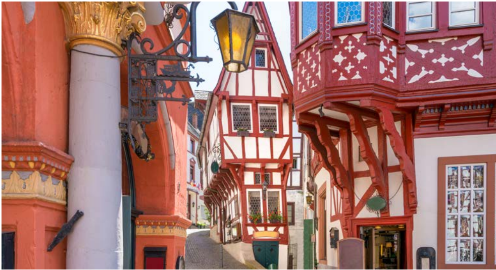
Fachwerkromantik pur in Berncastel-Kues

Sie besuchen eine Stadt, in der schon die Römer ihre Spuren hinterließen und wo der berühmte Gelehrte Nikolaus von Kues geboren wurde. Schlendern Sie über den wunderschönen Marktplatz, vorbei an stolzen Fachwerk-Häusern und erstaunlichen Brunnenanlagen und besichtigen Sie das Geburtshaus von Nikolaus von Kues.