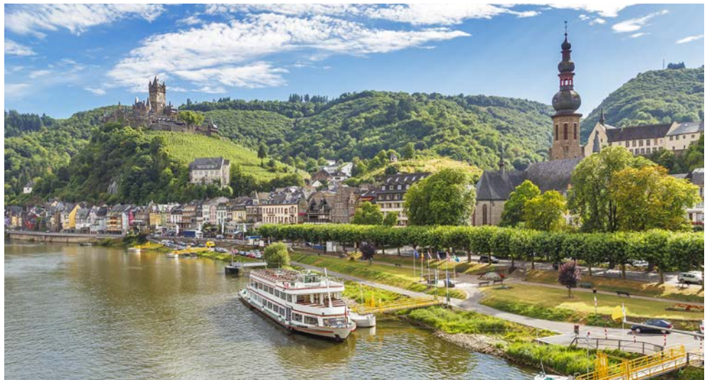
Freuen Sie sich auf das malerische Cochem