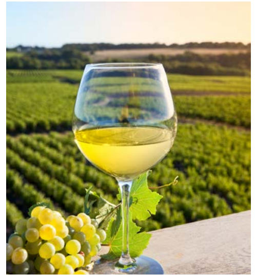
In vino veritas ...

Nach dem Frühstück Ausschiffung und Bahnfahrt zurück zum Heimatbahnhof (falls gebucht).