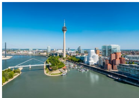
Der Mediahafen in Düsseldorf