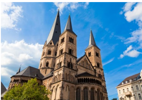
Der Bonner Münster

Gelegen auf einem Höhenrücken an den Ufern der Waal übt die Stadt bereits seit Jahrhunderten eine große Anziehungskraft auf die Menschen aus. So ließ Karl der Große auf dem Valkhof eine Pfalz errichten und Friedrich Barbarossa besaß hier eine Burg. In der Umgebung stoßen viele Landschaftstypen aufeinander. Hügel, Wälder, Polder und Bäche. Die Stadt liegt mitten in der Natur, mit viel Grün und Wasser, und bietet sowohl dem Bewohner als auch dem Besucher zahlreiche Erholungs- und Entspannungsmöglichkeiten. Lernen Sie Nimwegen gern auf einem Stadtrundgang im Rahmen des zubuchbaren Ausflugspaketes kennen.