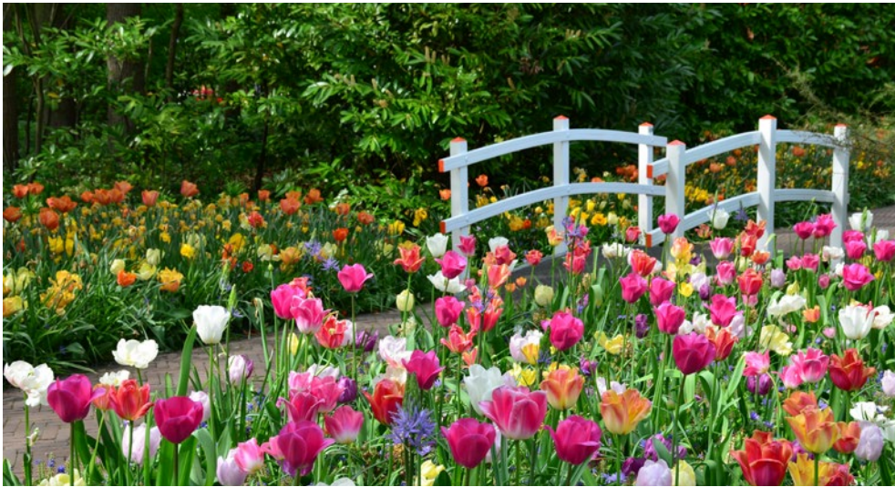
Frühling in den Niederlanden – ein wahrer Augenschmaus

symmetrischen Gestaltung, die Erasmus-Brücke, auch bekannt als der Schwan, und natürlich der Euromast mit dem Panoramarestaurant „Krähennest“. Ihr Schiff fährt weiter in Richtung Nimwegen.