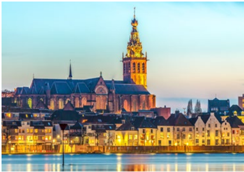
Am Ufer von Nimwegen

symmetrischen Gestaltung, die Erasmus-Brücke, auch bekannt als der Schwan, und natürlich der Euromast mit dem Panoramarestaurant „Krähennest“. Ihr Schiff fährt weiter in Richtung Nimwegen.