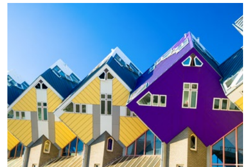
Die Kubus-Häuser in Rotterdam

Am nächsten Tag können Sie sich einen wahren Augenschmaus gönnen und sich dem überwältigenden Farbenspiel des berühmten Keukenhofs hingeben. Jedes Jahr im Frühling blüht ein Meer aus Zwiebelblumen im wohl größten Tulpengarten der Welt.