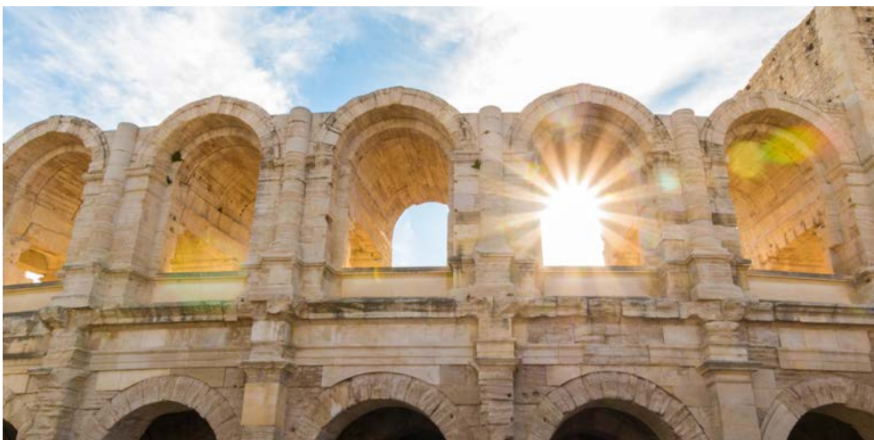
Das Amphitheater von Arles

Bitte beachten Sie: Bedingt durch den Reiseverlauf kann nur einer der beiden Ausflüge, „Schloss Cormatin“ oder „Ausflug Beaune und Hotel Dieu mit Weinkostprobe“, gebucht werden.