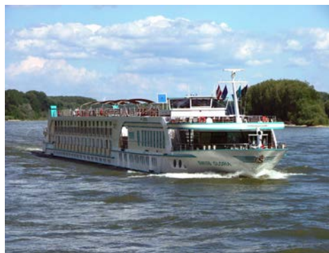
Ihr Schiff – die GLORIA

Trinkgelder: Getränke und Trinkgelder an Bord sind nicht eingeschlossen. Diese sind an Bord zahlbar. Die Zahlung der Trinkgelder ist freiwillig und richtet sich nach der individuellen Zufriedenheit.